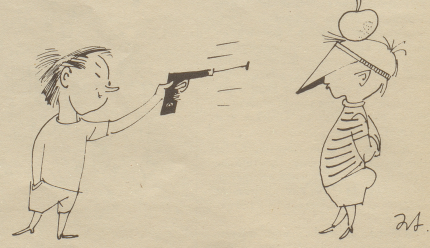
Vorsorge ist besser als Fürsorge