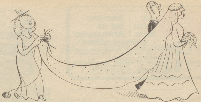
Die fleißige Brautjungfer

Die großen Vier! Wie geschickt die Bezeichnung erdacht ist! Wenn man sie umkehrte, hieße es: Die vier Großen. Und die Spaßvögel würden scheinheilig fragen: Die vier großen was? Bobby Bums