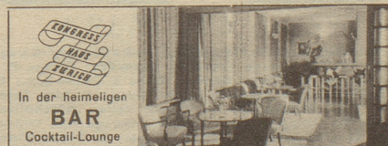
In der heimeligen BAR Cocktail-Lounge