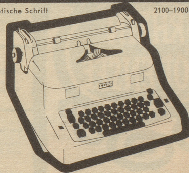
2100-1900 vor Chr.