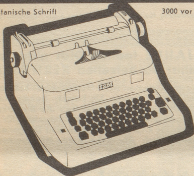
3000 vor Chr.