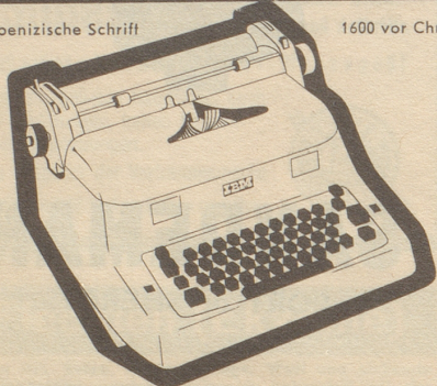
1600 vor Chr.