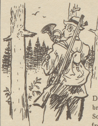
Das Jagdhorn und die «Horn am Munde».

(dick bestrichen) auf, behandle weiter, bis die Geschwürränder weich geworden sind und sich abgeflacht haben. Als innerliche Unterstützung, zur Anregung des örtlichen Blutkreislaufes, nehme man täglich 2-3mal 10 Tropfen Hametum-Extrakt in einem Löffel Wasser oder auf einem Zucker ein. Die Dosis kann ohne weiteres auf 1/2 bis 1 Teelöffel erhöht werden. Hametum-Extrakt wirkt vor allem auf venösem Gebiet in auffallender Weise entzündungswidrig. Hametum-Salbe (Fr. 2.30) und Hametum-Extrakt (Fr. 4.15) sind in allen Apotheken und Drogerien erhältlich, wo nicht, durch die Generalvertretung Homöopathie Dr. W. Schwabe: Römerschloß-Apotheke , Dr. W. Lang, Asylstraße 70/b, Zürich 7, Tel. (051) 32 60 10.