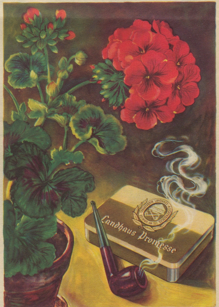
Ein Pfeifentabak mit natürlichem blumigem Aroma und auffallender Milde. Import-Klasse