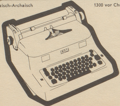
1300 vor Chr.