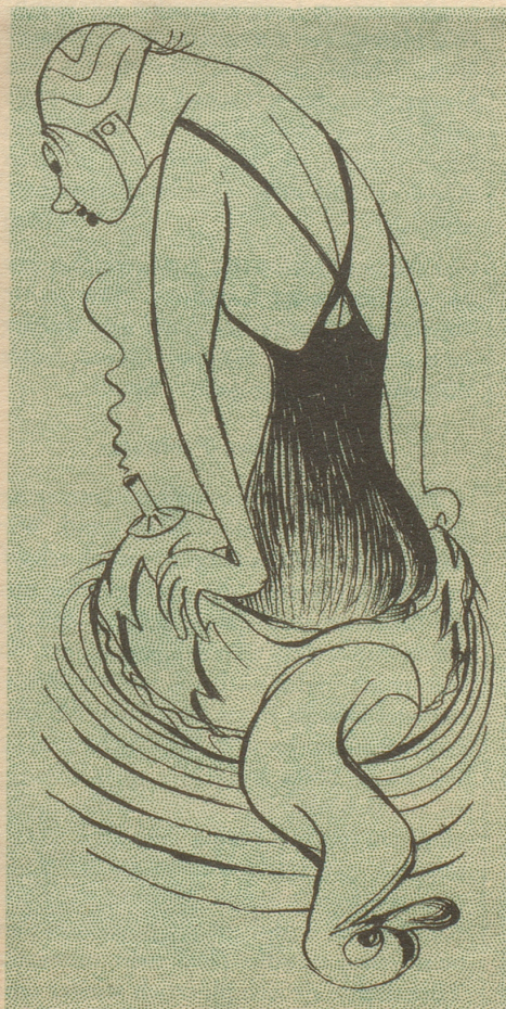
Leda und der sterbende Gummischwan

Liebes Bethli! Kürzlich hat mir jemand das hübsche Bändchen «Die Bernerin» geschenkt. Da steht u. a. viel Unterhaltsames über die Bernerin vergangener Tage und ihre Lebensgewohnheiten. Nicht nur verstanden meine Vorfahren viel besser als wir heutigen, die Feste zu feiern wie sie fallen, so daß sie bei den anscheinend damals sehr sittenstrengen Zürcherinnen geradezu in den Ruf der Lebenslustigkeit, ja der Frivolität kamen, nein sie machten sogar noch Feste, wo sich nur Gelegenheit dazu bot. Unsere ehrwürdigen Ur-Ahnerinnen verstanden aus allem ein Fest zu machen, sogar aus der uns so verhaßten – Bettsunnete! Während wir heutigen diesem Ereignis mit Hangen und Bangen entgegensehen (wie ist wohl das Wetter ... kommt ächt die Putzfrau ... ist wohl der Gemahl bei Laune um etwas Hand anzulegen?), bereiteten sie dasselbe vor wie ein Fest: Nicht nur wurde gebacken und geguetzelt wie auf Weihnachten, man schaffte sich sogar eigene Bettsunnete-Toiletten an in fröhlichen Farben und mit freigelegten Ausschnitten (angeblich der Hitze wegen), und am nächsten heißen Tage wurden die schweren Matratzen und raschelnden Laubsäcke aus den dunkeln Stuben und Betteninhalt hervorgezerrt und auf die Sonnseite der Gasse ans helle Tageslicht geschleppt und dort in male-