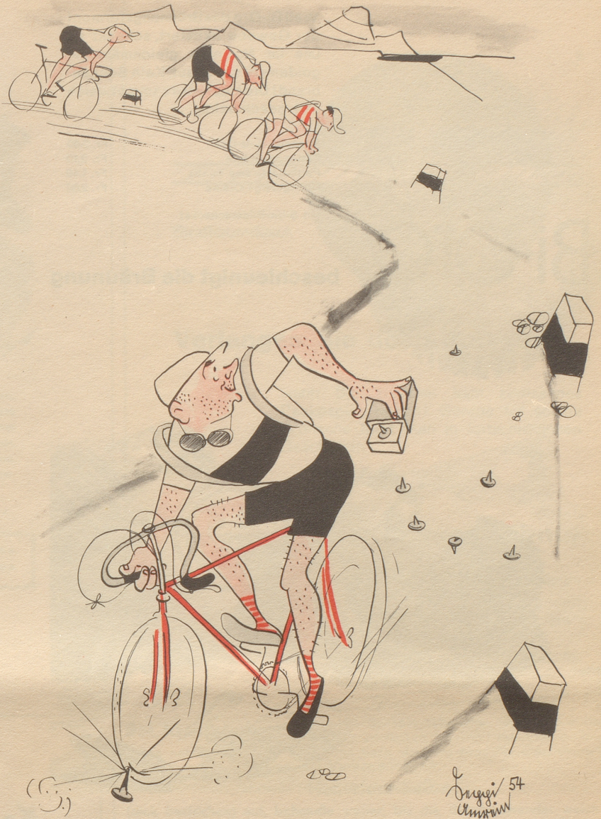
Wer andern eine Grube gräbt fährt selbst hinein

Hauptme, fascht überschlage. Vo do also isch das Gschmäggli cho! Und was erscht zum Vorschyn cho isch! Jo, die Mueter het öbbis Schöns agschteilt gha.