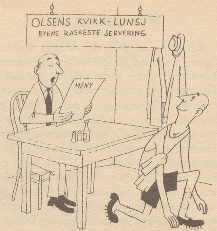
Das Restaurant mit der schnellsten Bedienung Tyrihans

Viele der verschiedenen Vehikel mit Aufschrift «Sonderfahrt» sehen manchmal schon eher nach einer sonderbaren Fahrt aus. bi