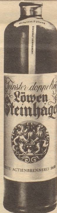
Erste Aktienbrennerei Basel