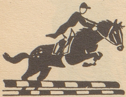
Spitzenreiter aus dem ganzen Laden am Start Broderie-Laden?

Französische Tiefdruckanstalt sucht Retoucheur schwarz und mehrfarbig. Offerten unter