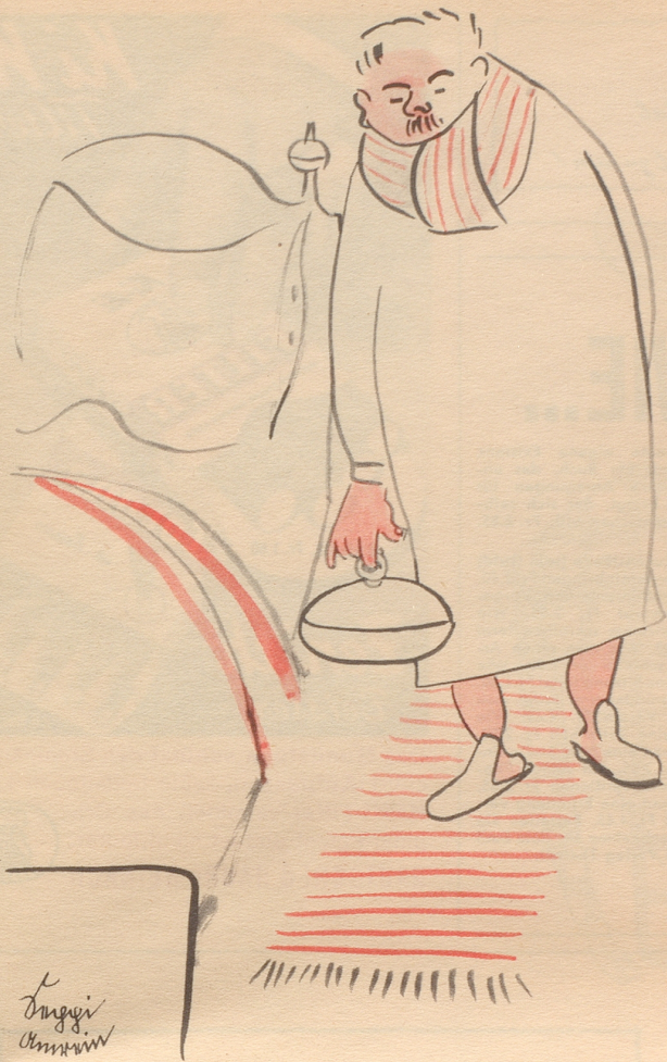
Curling auch im Sommer 1954