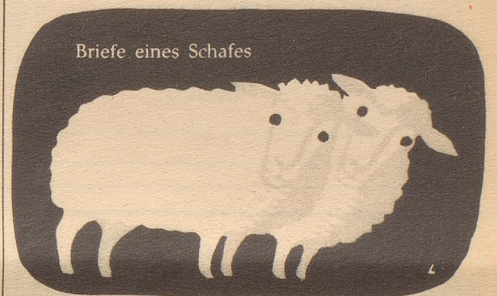
Briefe eines Schafes