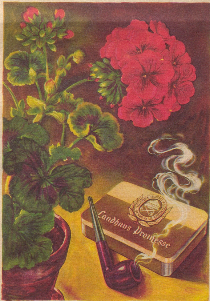
Ein Pfeifentabak mit natürlichem blumigem Aroma und auffallender Milde. Import-Klasse