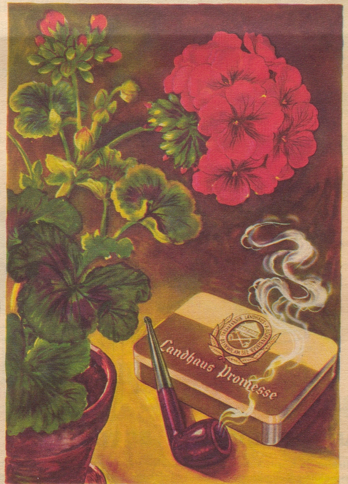
Ein Pfeifentabak mit natürlichem blumigem Aroma und auffallender Milde. Import-Klasse