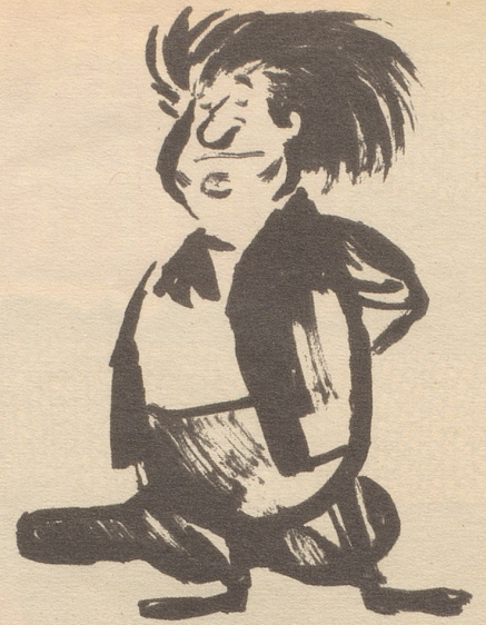
«Für d'Haar gir's nüt bessers als Musik»

Die ungarische Bevölkerung mag gewünscht haben, es wäre nicht nur bei einem Fußball-Ländermatch so. Bums