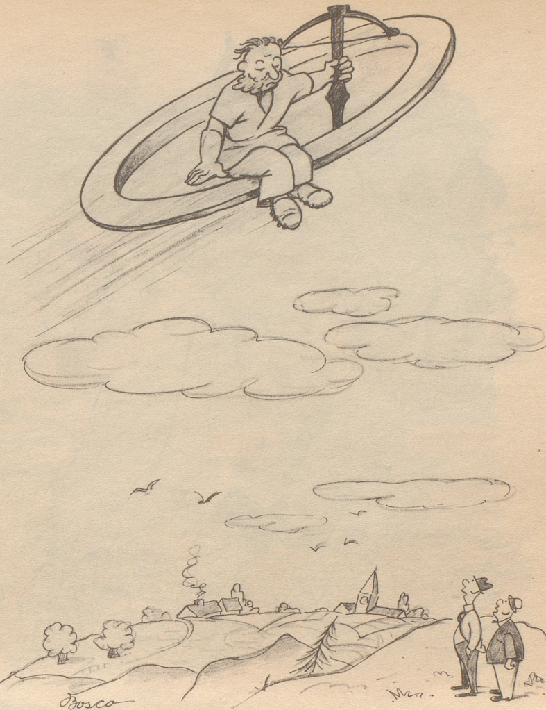
Fliegender Wilhelm Teller

Dann setzte er sich bescheiden hin und war sehr froh. Die Gesellschaft war es ebenso, und somit hatten beide Teile keinen Grund, nicht von Herzen weiterzufeiern und sich des Lebens zu freuen.