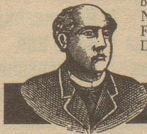
PASTOR KÖNIG'S NERVEN STÄRKER

untergräbt Ihre Gesundheit! Wenn Ihre Nerven empfindlich sind, wenn plötzlicher Lärm oder Ungewohntes Sie reizt, dann nehmen Sie «Königs Nervenstärker». Dieses Präparat hat manchem geholfen. Es beruhigt, fördert den gesunden Schlaf und ist empfehlenswert bei nervösen Verdauungsbeschwerden und chronischen Nervenleiden. — Die Flasche Fr. 7.— in Apotheken und Drogerien. Gratisbroschüre auf Wunsch.