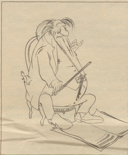
Illustrationsprobe aus «Gesammelte Zeichnungen»

«Man kann den Karikaturisten Giovannetti auf die Formel bringen: Bildhumorist mit groteskem Einschlag. Wie reich er an Einfällen ist, geht aus der Tatsache hervor, daß er mit Vorliebe in Zyklen zeichnet. Eine erste Erfindung weckt gleich eine ganze Reihe neuer Ideen und diese runden sich zu einem fröhlichen Romanchen, das den Beschauer ergötzt. Wie hat er die neuen Ritter, Räuber in Mexiko, konterfeit! In der grotesken Übertreibung liegt seine zeichnerische Stärke und auf dieser Humorebene liegt seine überwältigende Komik.» Solothurner Zeitung