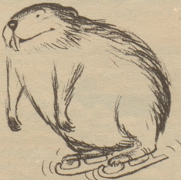
Illustrationsprobe aus «Aus meiner Menagerie»

«Jeder kennt Giovannettis fröhliche Tierzeichnungen aus dem Nebelspalter. Es bietet aber die Sammlung seiner poesievollen Einfälle in einem eigenen Bilderbuch «Aus meiner Menagerie», das im Nebelspalter-Verlag Rorschach in sorgfältigster Ausführung herausgegeben wurde, eine freudige Ueberraschung. Man blättert vergnügt und verweilt sich versonnen bei seinen Murmeltieren, Igeln und Vögeln, die so viel Menschliches haben, daß wir uns in ihnen wiedererkennen.» Neues Winterthurer Tagblatt