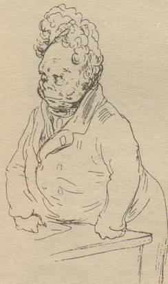
«Jawohl, meine Herren, ich habe die Stirn, offen zu kritisieren...»

Illustrationsprobe aus «Unsterbliche Rednertypen»