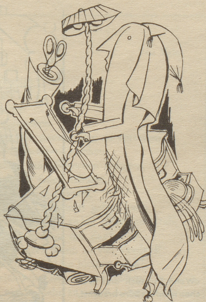
Unser Heim im Frühling

Die Koffer waren gepackt, die dringendsten Arbeiten erledigt, ich sollte – besser gesagt – durfte endlich verreisen. Wie ich mich freute ... und wie ungern ich doch wieder ging. Man weiß ja, wie es ist, wenn man seit Jahren nicht mehr ausgebrochen ist und es dann doch auf einmal wieder tun