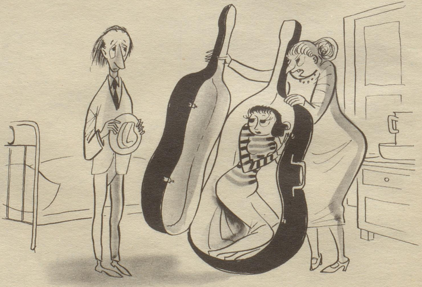
«Das also ist Ihr Kontrabaß, auf dem Sie üben wollen. Da bin ich aber gespannt, wie das Instrument klingt, Herr Mieter!»

Ueberall auf den Helgen in den Prospekten, aber nicht nur auf ihnen, sondern auch in den vielen Zeitschriften, die uns spießige Hausfrauen zur höheren Kunst der Heimgestaltung erziehen möchten, finde ich etwas, das ich – noch so gerne – imitieren möchte, wenn ich mich getraute. Denn: Ueberall sehe ich herrliche Topfpflanzen, vom üppiggedeihten Gummibaum über die Aralie zur Zimmerlinde. Und diese Pflanzen stehen gelassenen Herzens ganz einfach mit ihren Kübeln auf dem blutnaktigen Stubenboden, der allermeistens ein Parkett ist,