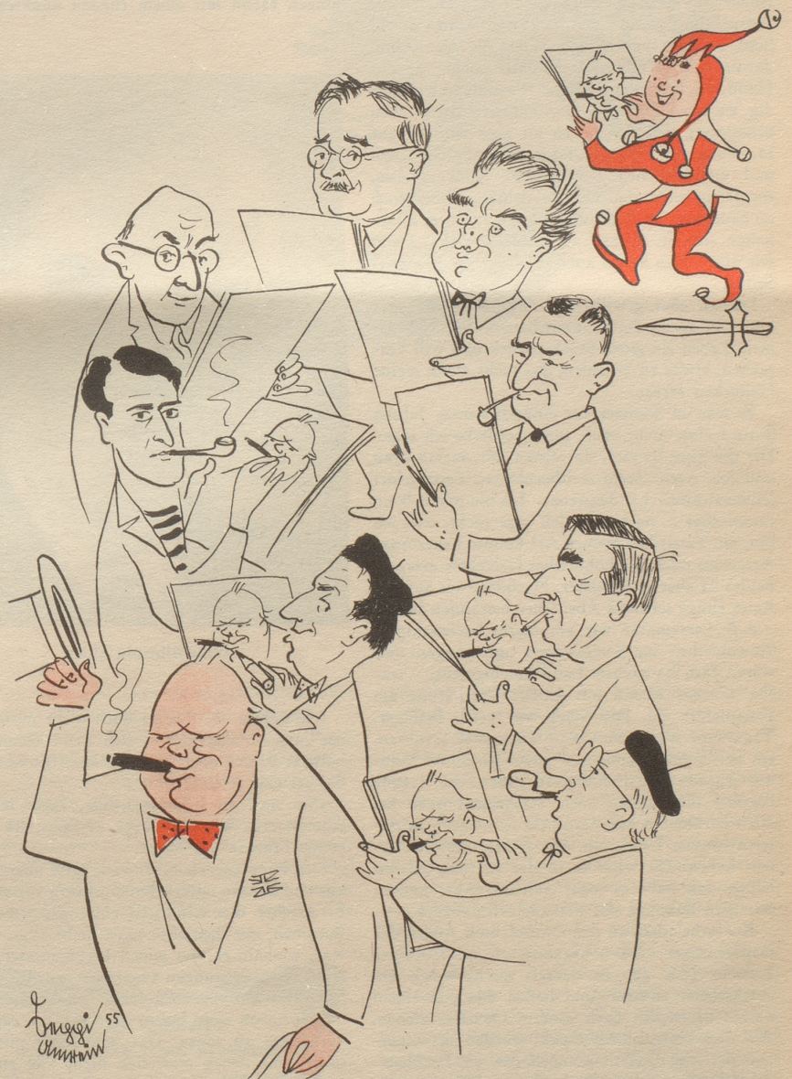
Abschied von den Karikaturisten

Schminke = Runzelkitt Damensalon = Jungweibermühle Frauenträne = große Wasserkraft haga