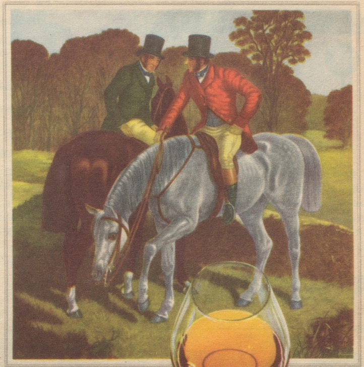
Im Asbach-Uralt ist der Geist des Weines