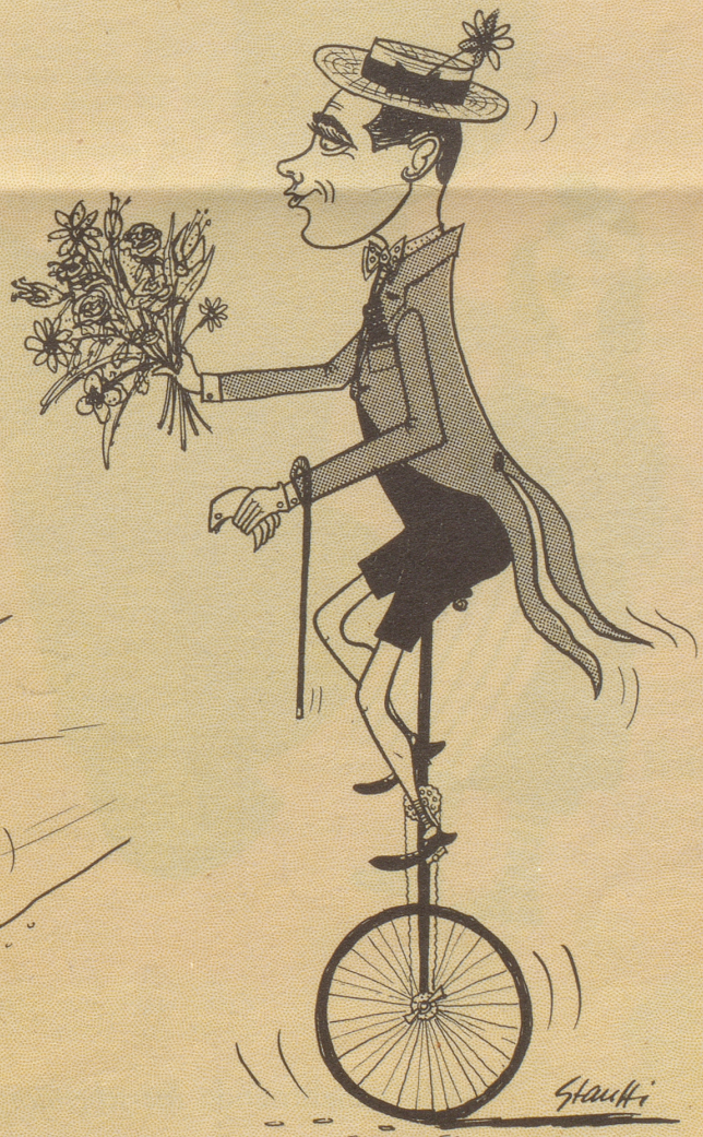
Pedaleur de Charme Kobler