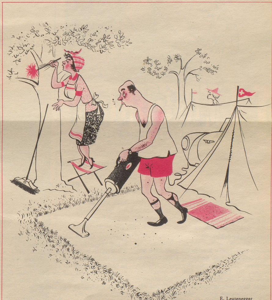
«Wenn i scho dä Kämpingrummel mitmache, so söll doch alls so ordelig gaa wie deheim!»

aufgefischt und aufgetischt Wie United Press meldet, die es ihrerseits aus dem Ostdeutschen Rundfunk aufgeschnappt zu haben erklärt, haben die Organisatoren des diesjährigen «Jugendtreffens» in Warschau Königin Elisabeth, Präsident Eisenhower, Präsident Coty und Präsident Woroschilow nach Warschau eingeladen. Queen Elizabeth, das wäre noch zu begreifen, obschon Prinz Charles sicher noch jugendlicher wäre –, aber die bejahrten Herren Präsidenten sind doch sicher über das Alter der naiven Freude an Marionettentheater hinaus. Mit Ausnahme des Herrn Präsidenten Woroschilow, der daran von Haus aus gewöhnt ist und, wie man aus sonst zuverlässiger Quelle vernimmt, selbst an Drähten zappelt. Jedenfalls wollen wir in Zukunft nicht mehr von Unbescheidenheit reden, wenn der Kanarienvogelzüchterverein Hinter-Krachlingen zur Feier seines fünfjährigen Bestehens glaubt eine Delegation des Bundesrates erwarten zu dürfen. AbisZ