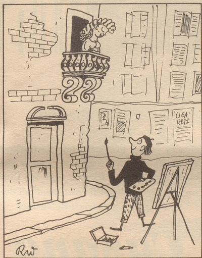
Das Ständchen des Malers

Zu: «ANALYSE DER ANGRIFFSTECHNIK» in Nr. 35