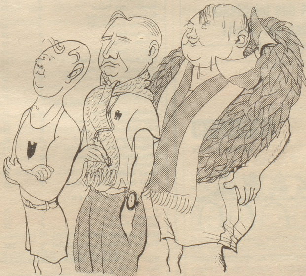
Steigerung: Sportler – Sportlehrer – Sportlerehrung