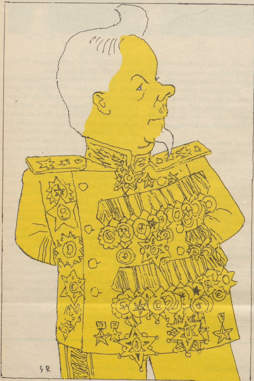
Marschall Nikolaj Bulganin