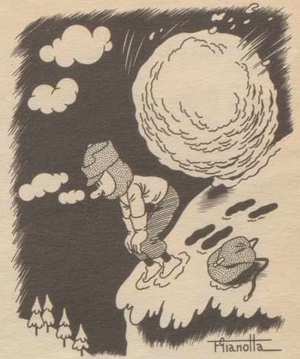
«Wie chum ich ächt da abe?»

Aus: George Mikes «A propos Ferien». Copyright by Cosmopress Genf und Diogenes Verlag Zürich