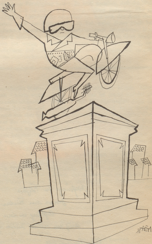
Ein Denkmal dem unbekanntem Raser, 1935–1955