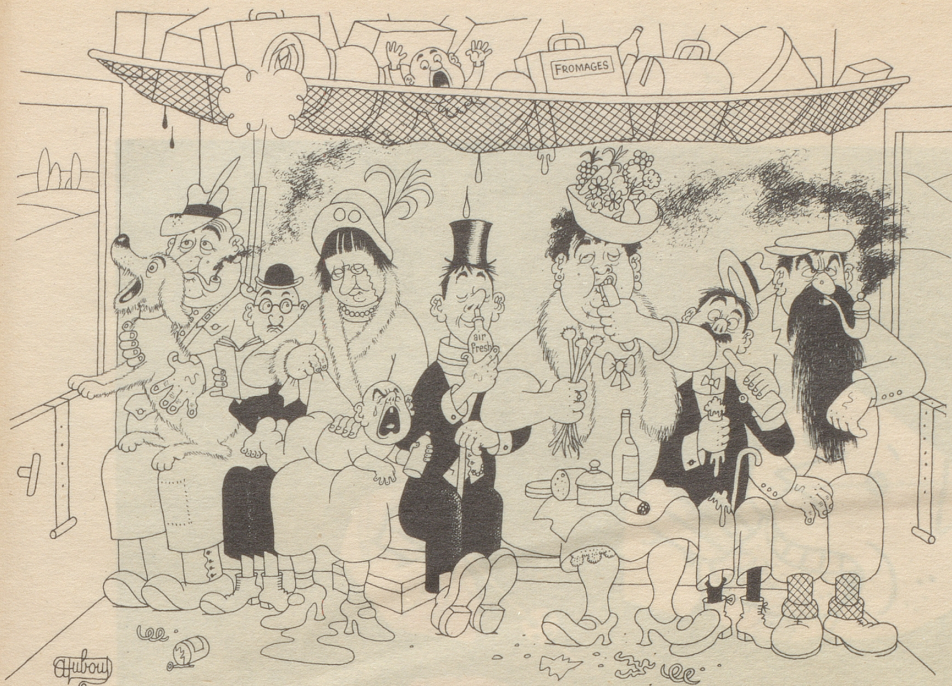
Ein Glück, daß es air-fresh gibt