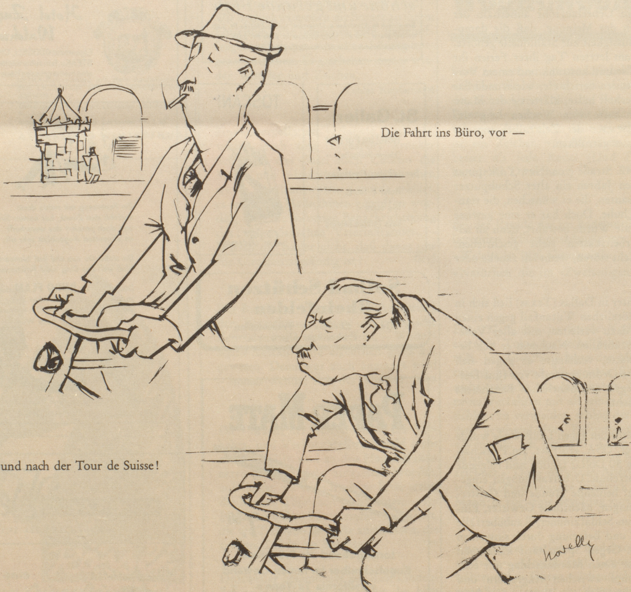
Die Fahrt ins Büro, vor —