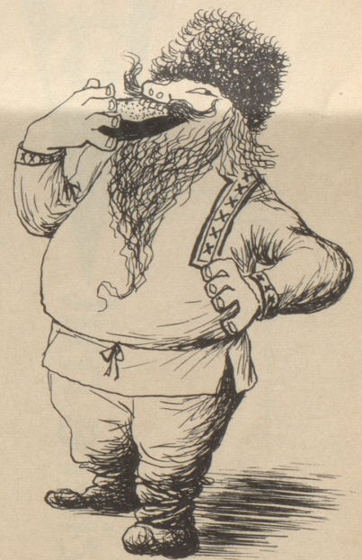
Aleksey Kornowitsch Brotow aus Nischni-Nowgorod, der größte Wohltäter der Menschheit, Erfinder des Brotes