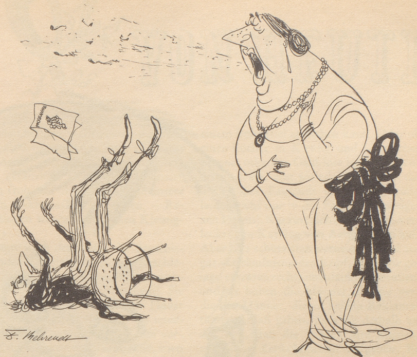
DAS war zuviel!

Die Porzellanfiguren sind beim Fall zerbrochen, der Regenschirm verschwunden, wahrscheinlich einem Sammler als besonders schönes Stück aufgefallen. Die Straßenjungen teilen sich in die Weintrauben und verkaufen die Zeitungen ein zweites Mal. Doch der arme Mann, dessen Identität man feststellen will, hält in der krampfhaft geschlossenen Hand ein geheimnisvolles Papier, dem der hilfreiche Apotheker entnimmt, daß er im Restaurant <Coquillère> für fünf Francs siebzig zwei Fleischgänge, einen Gemüsegang nach Wahl, Obst, Käse, schwarzen Kaffee mit Kognak und einen Viertel Rotwein haben kann. (Uebersetzt von n. o. s.)