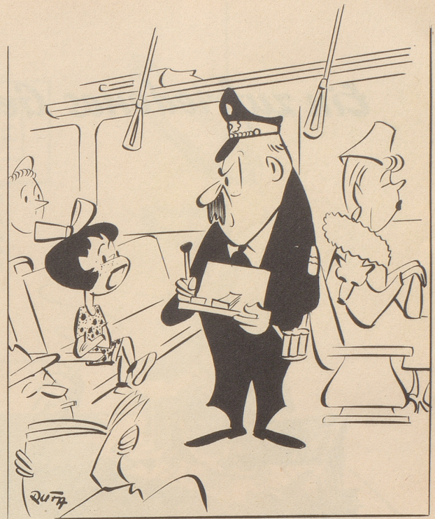
« Ein Tschentlemen fragt eine Dame nicht nach ihrem Alter! »