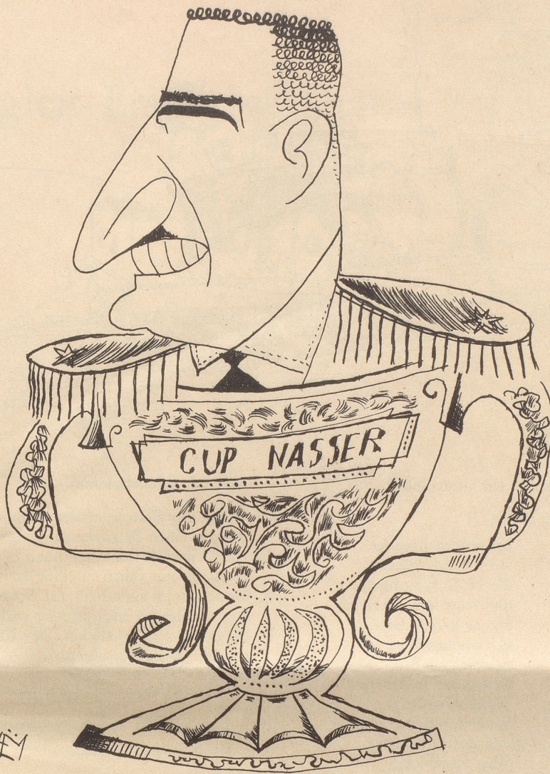
Der Wanderpreis an der nahöstlichen Vertragsbrecher-Olympiade