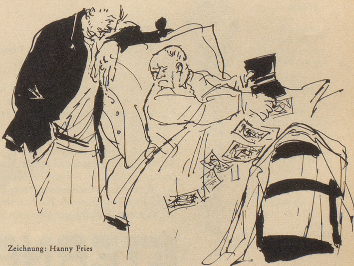
Zeichnung: Hanny Fries