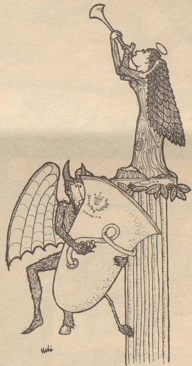
Der Teufel bläst das stärkere Instrument!

«Ist bereits geschehen! In der ungarischen Frage haben wir aktiv interveniert, indem wir die Sowjet-Botschaft gegen die Protestaktionen schützten, und was Ägypten anbetrifft, prüfen wir einen bedeutenden Preisaufschlag auf Benzin.» bi