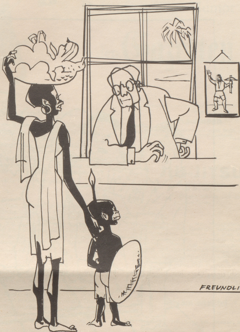
Erste Kundschaft im Konsulat Nairobi

Wie aber weiß man, ob Herr X. Y., der heute im Hause nebenan ein paar Reime vertont, auch wirklich je ein Liederfürst wird? Man kann es nicht wissen. Und eben darum muß die Wissenschaft schon frühzeitig Vorsorge treffen, daß aus-