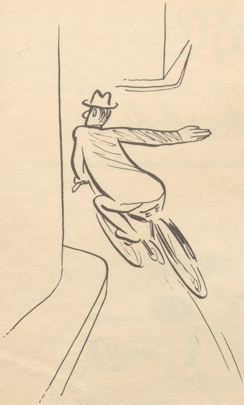
nach der Natur gezeichnet