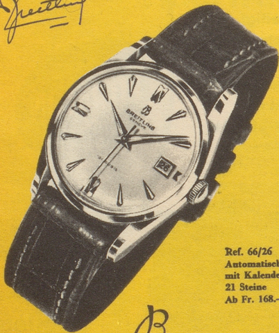
Ref. 66/26 Automatisch mit Kalender 21 Steine Ab Fr. 168.—