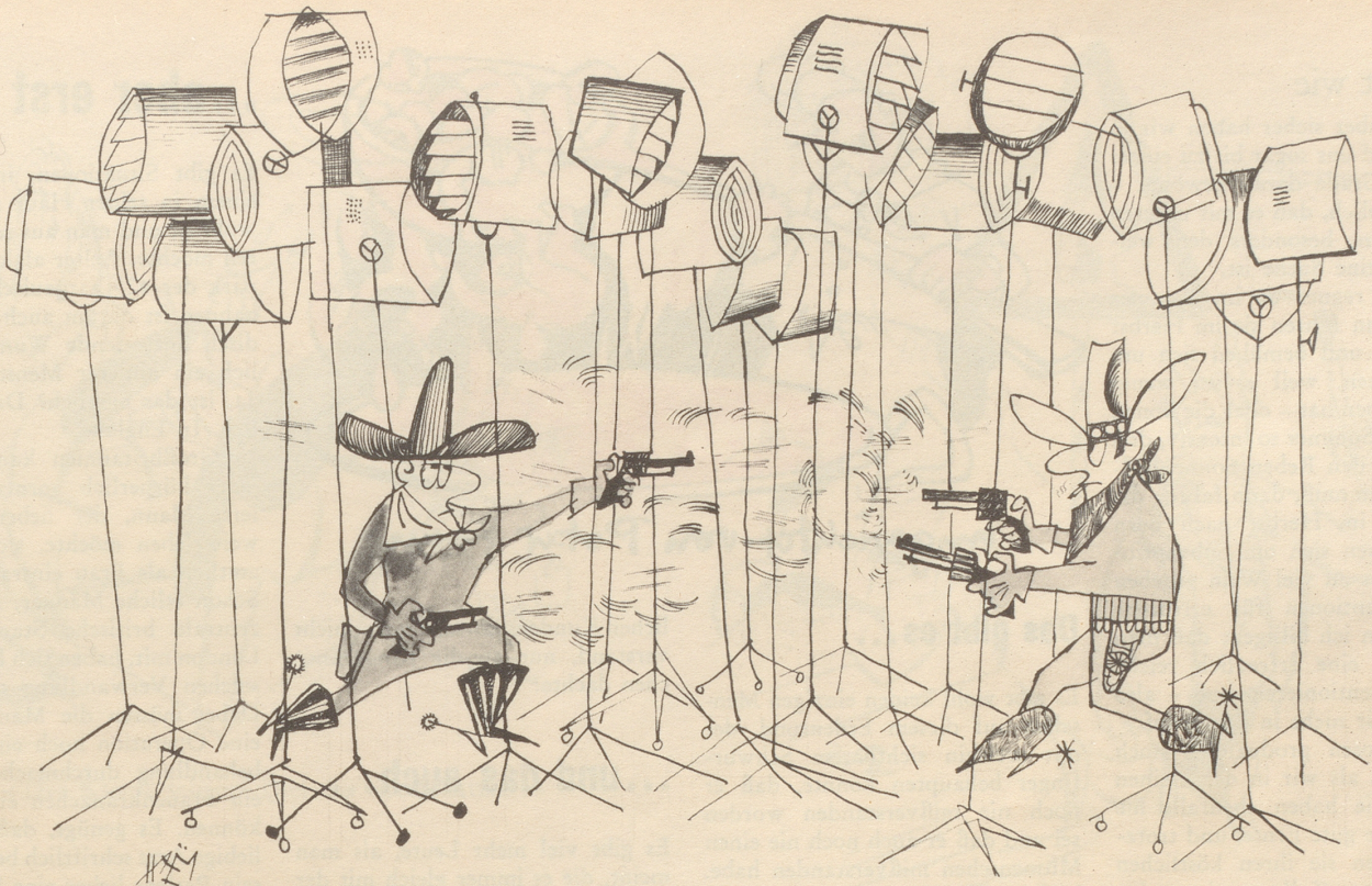
Im Wildwest-Atelier «Du machsch dänn scho na bis d mi trifftst!»