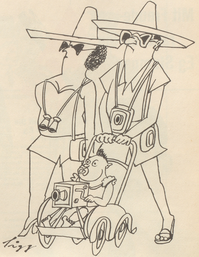
Klar zum Gefecht!