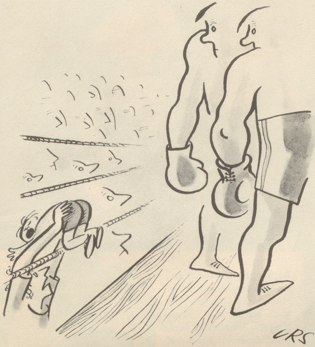
«Sind so guet und gänd dem Söibueb Chläpf!»