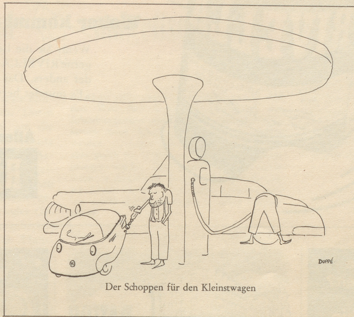
Der Schoppen für den Kleinstwagen

Der Vogt runzelte sehr ernsthaft die Stirn: «So kann das nicht weiter gehen mit euch, junger Mann! Das sind keine Sitten! Das führt euch zu bösen Häusern! Wär's in Vaduz passiert oder in der Schweiz, so säßet ihr jetzt drei Monate lang im Loch bei Wasser und Brot!