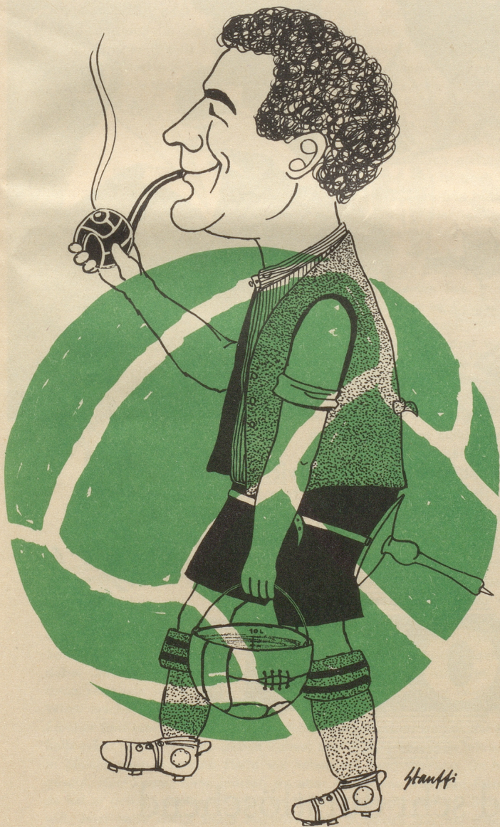
«Ueli, der Fußballer» (H. Schmidhauser)