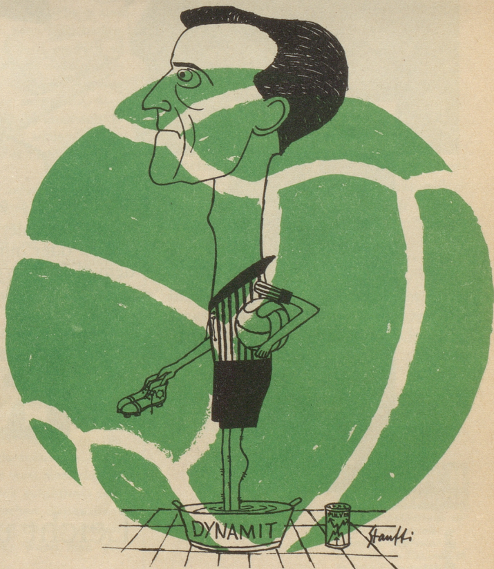
Casali, vor dem Match