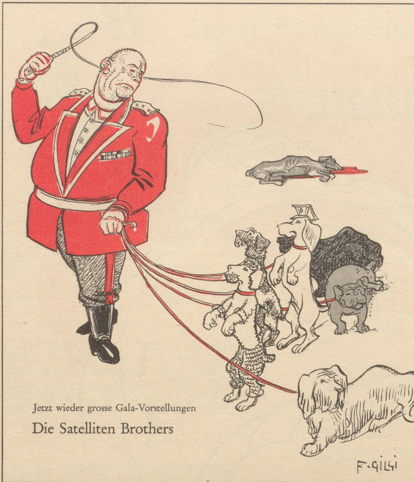
Jetzt wieder grosse Gala-Vorstellungen Die Satelliten Brothers